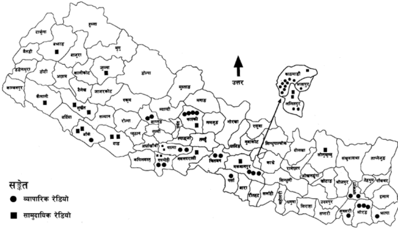
तस्बिर २: एफएम रेडियो स्टेसन भएको स्थान अङ्कित नेपालको नक्सा (स्रोत: रेडियो २०६०क: ४-५)। १५