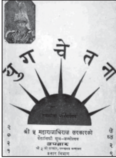
तस्बिर ७.३: रेडियो नेपालको प्रकाशन युग चेतना २०२१ ।