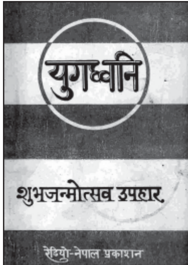
तस्विर ७.१: रेडियो नेपालको प्रकाशन युगध्वनि २०१८।