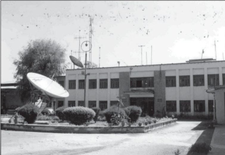
तस्बिर ३.२: रेडियो नेपालको आधुनिक प्रविधि सम्पन्न भवन ।

अस्थिर राजनीतिका कारण सरकार परिवर्तन भइरहने हुँदा त्यसको सीधा प्रभाव रेडियो नेपालमाथि पर्न गएको छ । कर्मचारीहरू सरकारी निर्देशनअनुसार नै चल्ने गरेको देखिन्छ । त्यहाँ भित्रका कर्मचारीहरूको मूल काम भनेको समाचार सङ्कलन गर्नु र प्रसारण गर्नु मात्रै हो भन्दा अत्युक्ति हुँदैन । किनभने