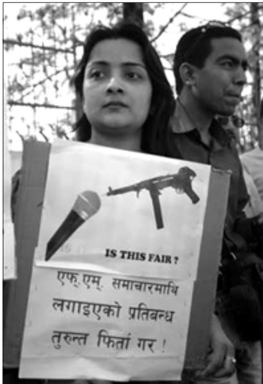
तस्विर ४.५: माघ १९ पछि बेरोजगार बनाइएका रेडियो पत्रकार विरोध प्रदर्शनमा ।

राखेर सरकारको सदबुद्धिका लागि प्रार्थना गर्ने, विचार तथा अभिव्यक्ति र सूचनाको हकसम्बन्धी संविधानका धाराहरू रेडियोबाट पाठ गर्ने, नबज्ने रेडियो सेट हुलाकबाट सूचना तथा सञ्चार मन्त्रीमार्फत मन्त्रीपरिषद्का नाममा पार्सल पठाउने, बाँदरका हातमा नरिवल दिने आदि । यसअलावा अर्को प्रकृतिको