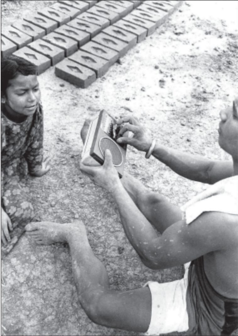
दाडका ईंटा मजदुर आफ्नो कार्यस्थलमा रेडियो बजाउँदै ।